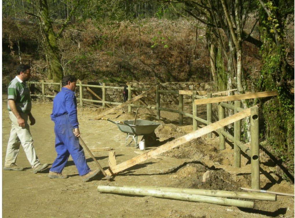
Construcción valla de madera, Santiago 2.011.