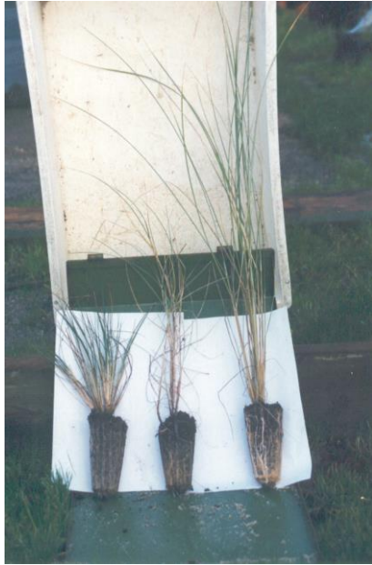
Ensayos de cultivo

Finalmente, destacar que IMEGA S.L, está implicada directamente en el desarrollo, ensayo y puesta a punto de nuevas técnicas de restauración ambiental que resultan esenciales para abordar en su integridad la cada día más necesaria conservación y restauración de nuestro común patrimonio natural.