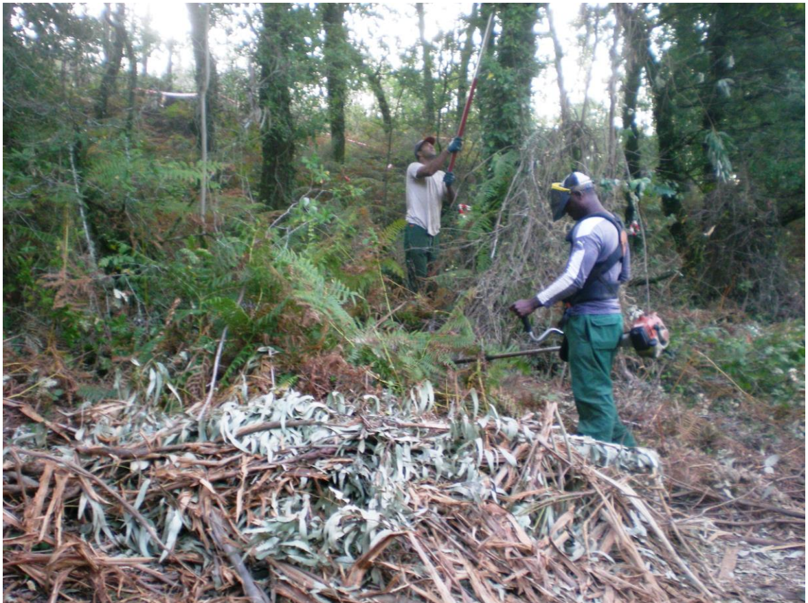
Tratamientos selvícolas manuales, Santiago 2.009