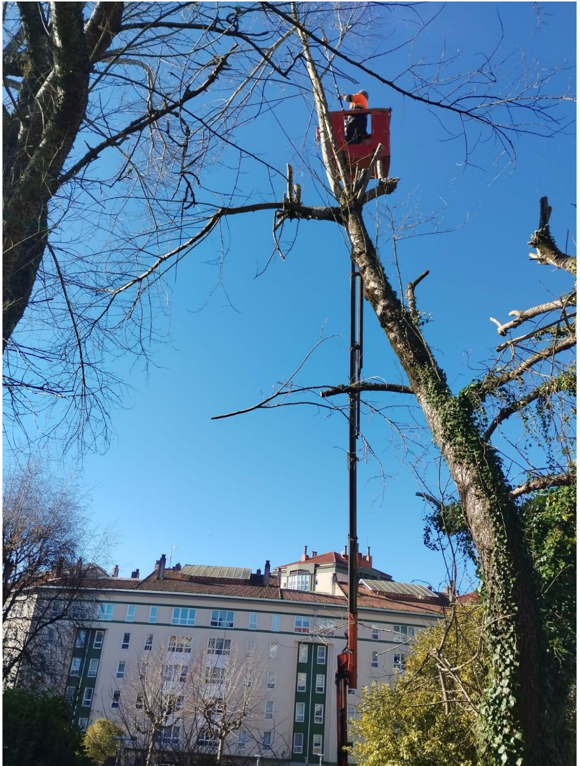
Poda de árboles de grandes dimensiones: IES Fontiñas-Santiago, 2.025