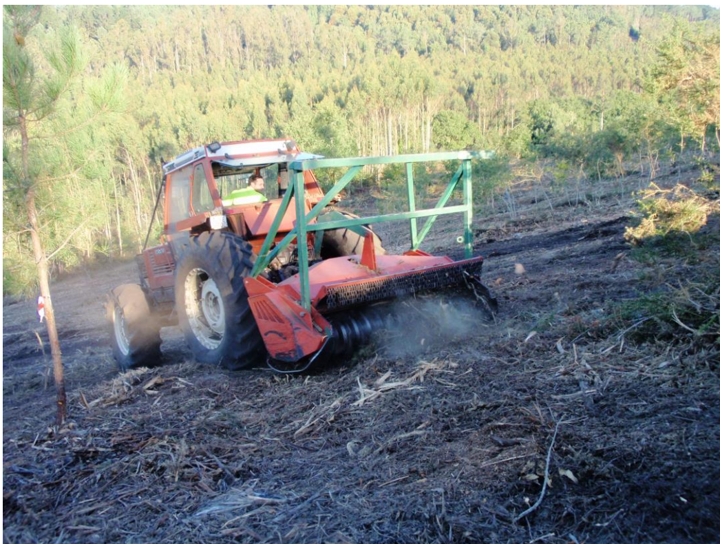
Trituración cepas y restos con rulo pesado, Santiago 2.010.