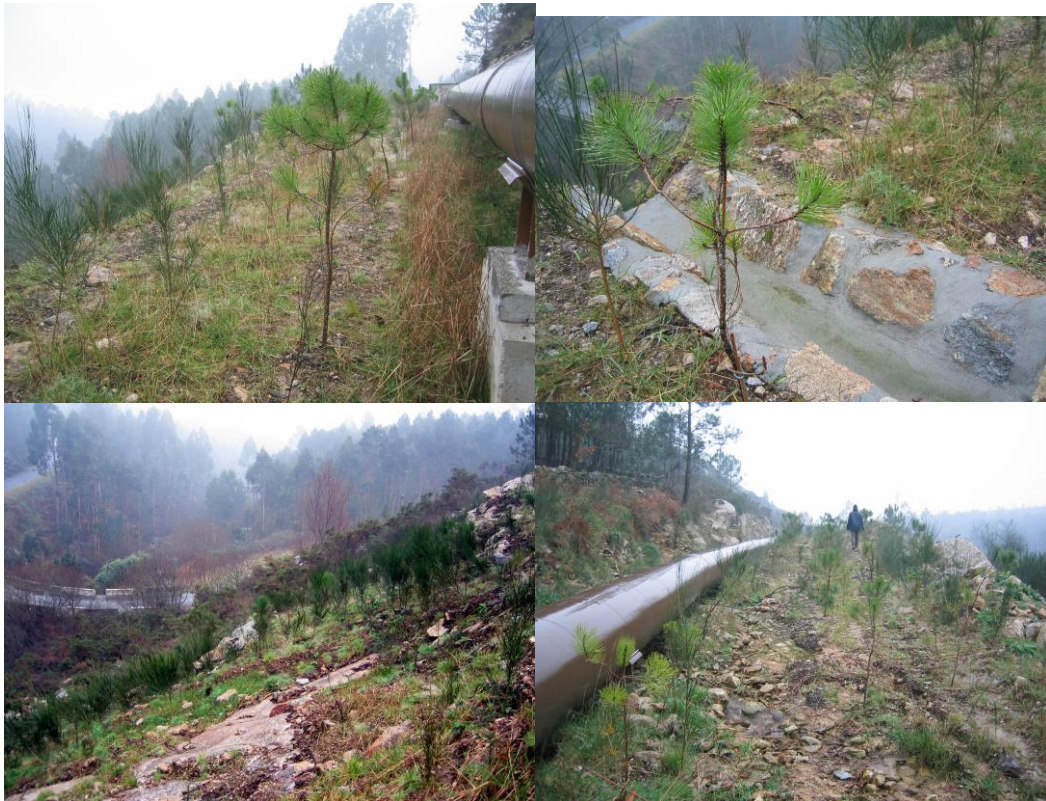
hidrosiembra y plantación de árboles y arbustos (Rivadavia, Orense, 2.004).