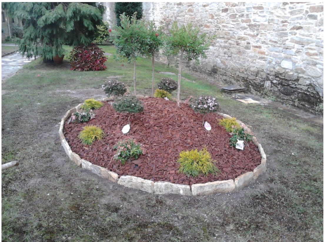
Parterre en Hostal Reyes Católicos, Santiago 2.015