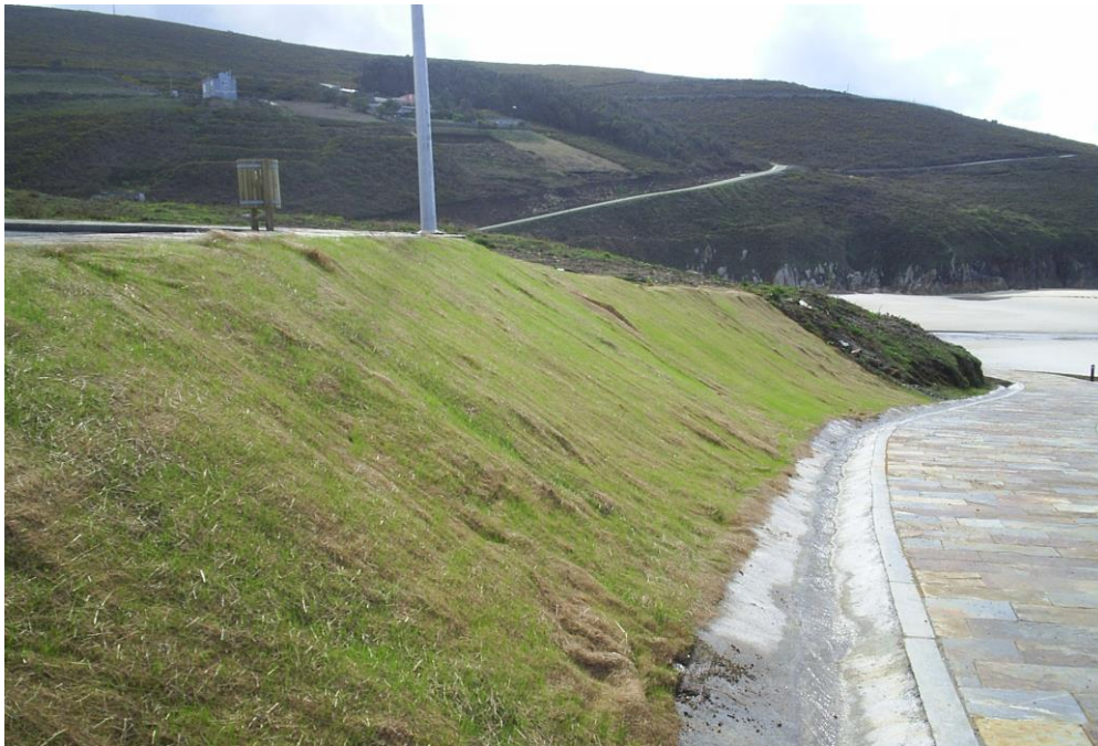
Hidrosiembra y colocación manta orgánica anti-erosión en Arteixo, 2.006.