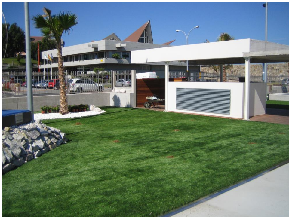
Plantación de Washingtonias y césped artificial en C/ Francisco Vázquez en el centro de Coruña, 2.009.