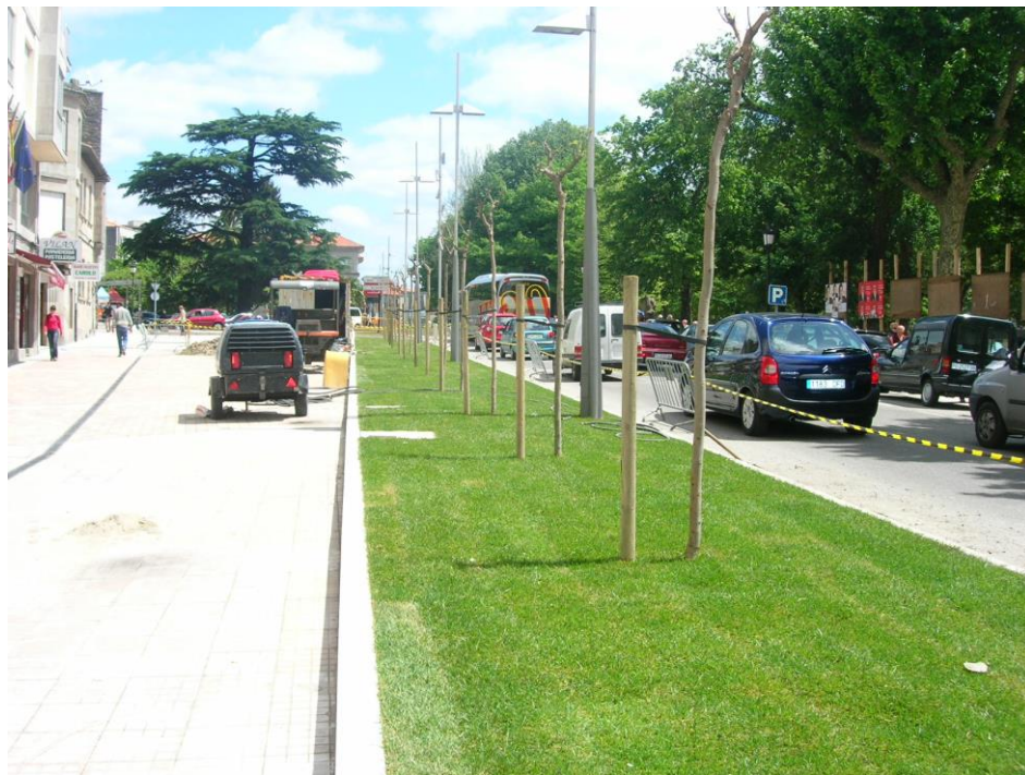
Plantación Jacarandás, tepe de césped y riego automatizado en mediana (junto alameda Pontevedra, 2.007)