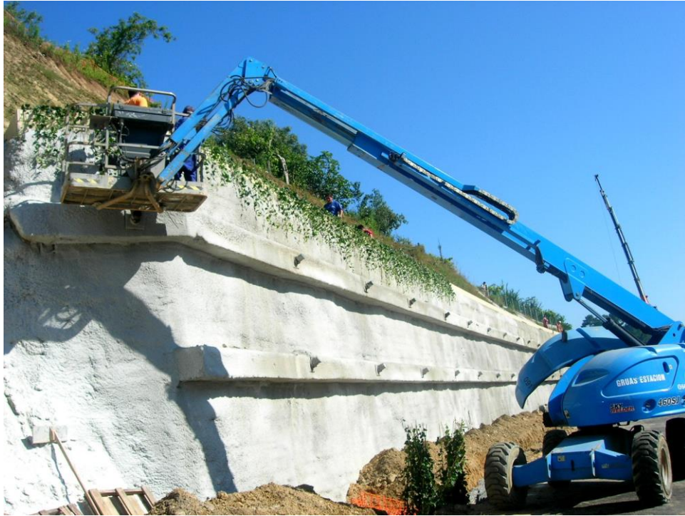
Apantallamiento muro autopista Santiago-A Estrada con yedras fijadas con cables, 2.007.