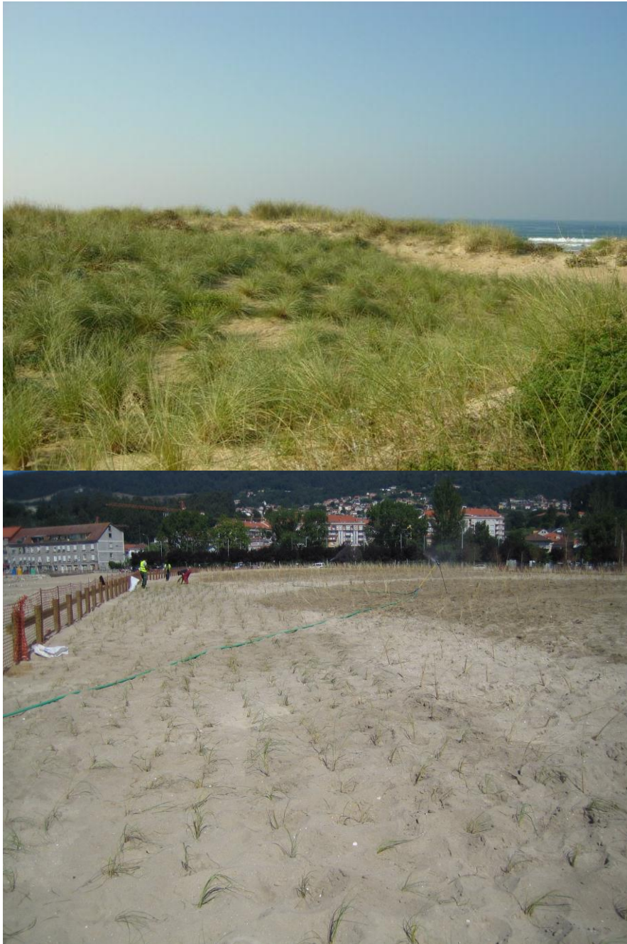
Foto superior: regeneración de la vegetación dunar en el Parque de Corrubedo como consecuencia vertidos del petrolero Prestige (2.003).

Foto inferior: restauración dunar en Cangas del Morrazo (2.009).