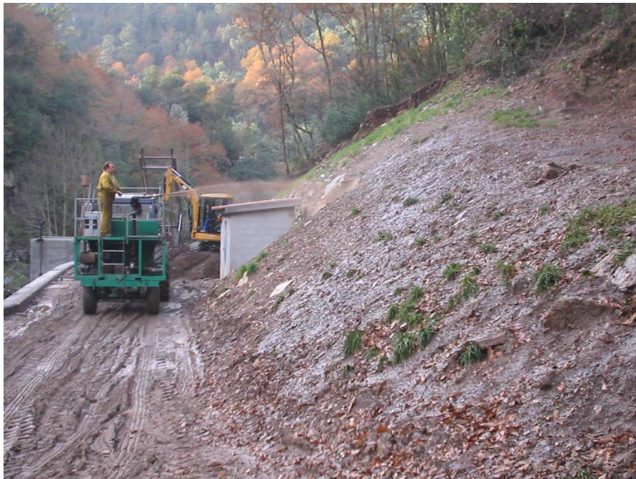
Aplicación hidrosiembra en talud A Lama-Pontevedra, 2.004.