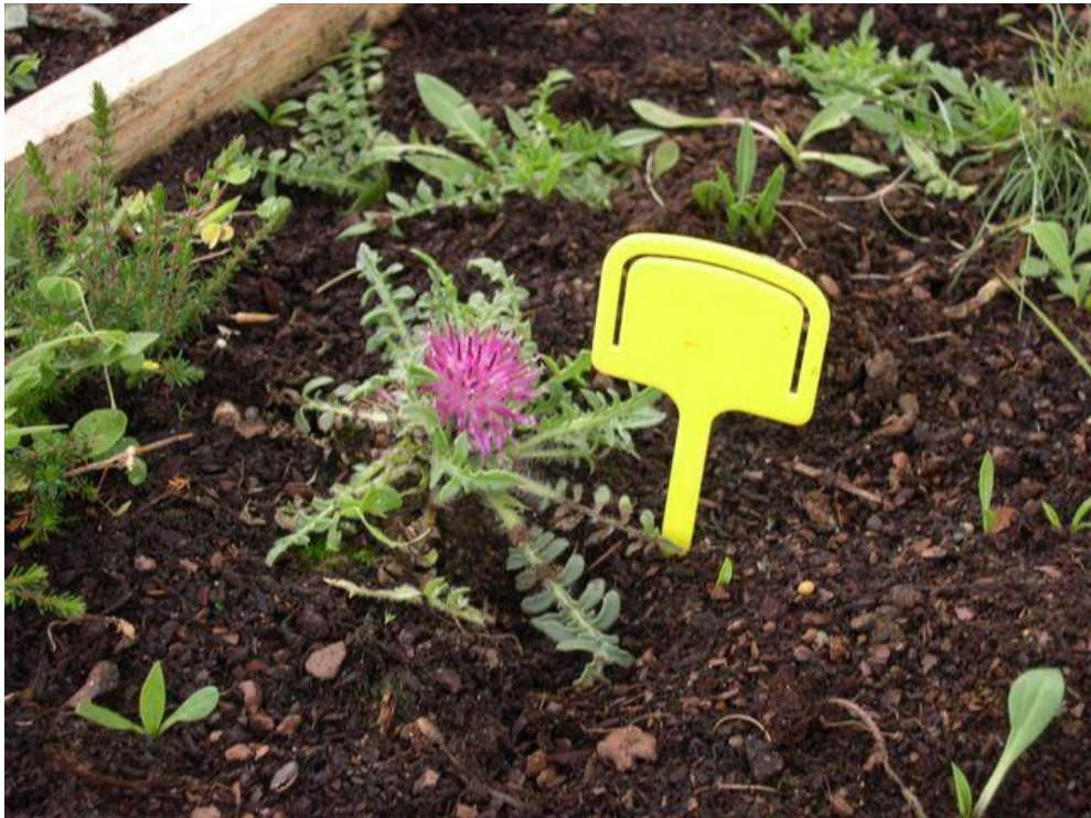
Recuperación en vivero y plantación especie en peligro extinción Centaurea borjae, 2.004.