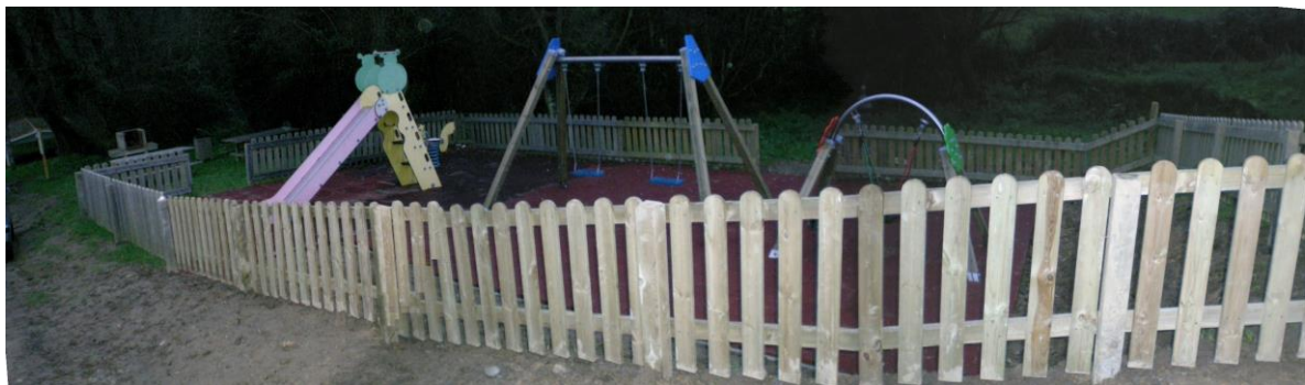
Construcción área infantil en Simou-Mugardos, 2.009.