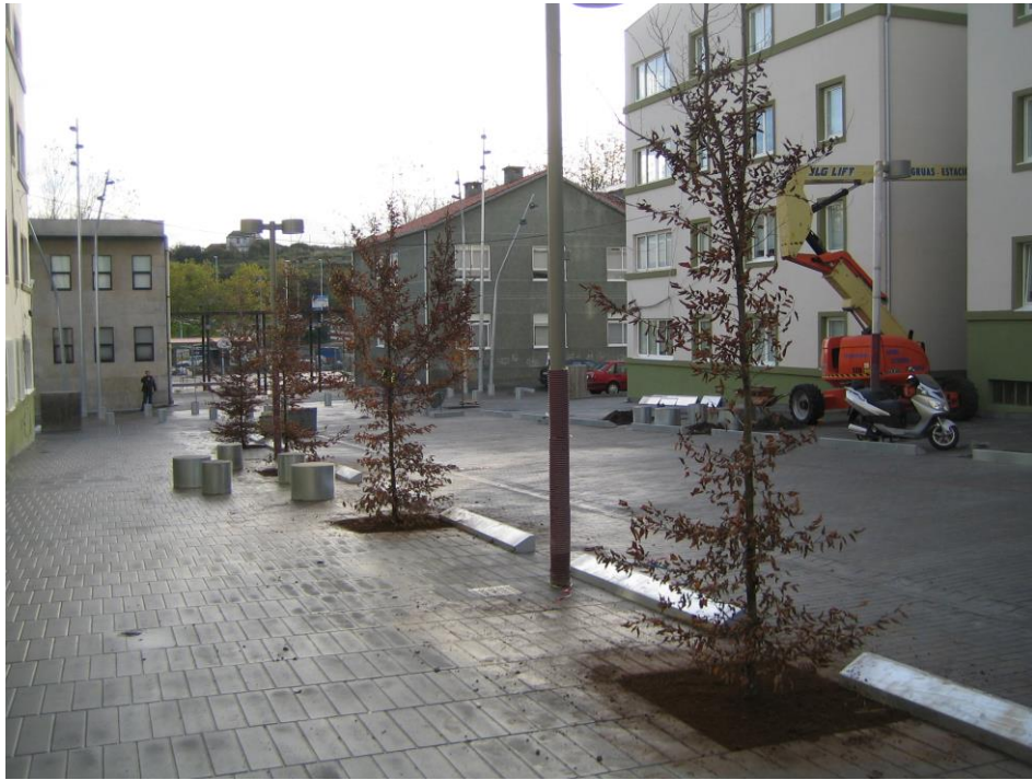
Plantación arbolado en alcorques, Los Rosales-La Coruña, 2.010.