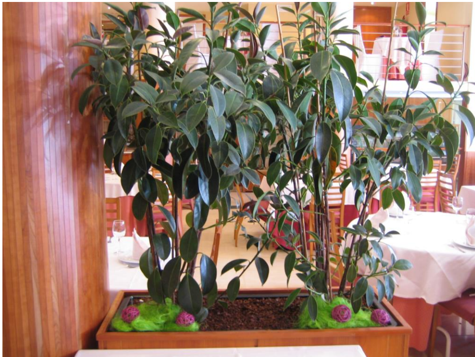
Jardinería de interiores: Hotel Santa Lucía, 2.010.