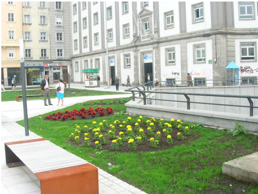
Parterres con planta de temporada, Plaza España-Ferrol, 2.007.