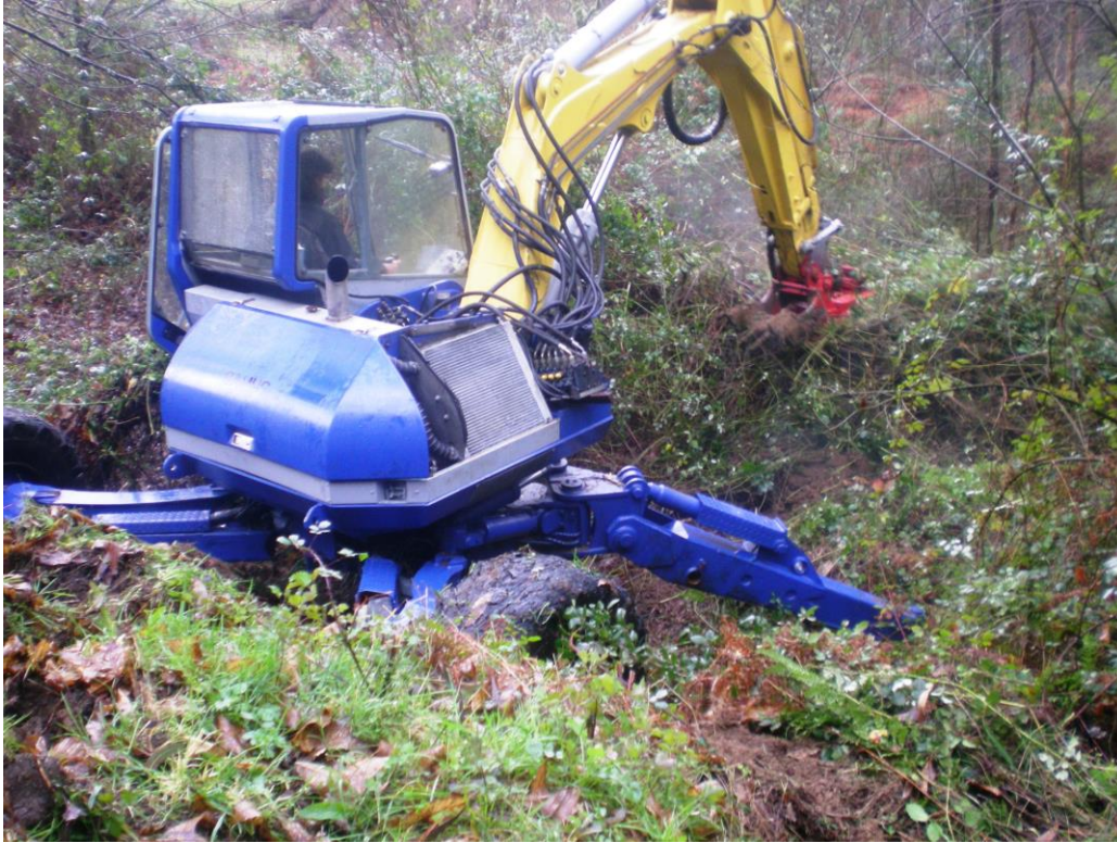
Desbroces con retroaraña en terrenos de pendiente (Valadouro 2011)