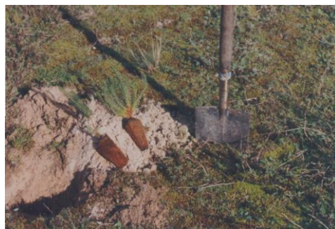
Ensayos de plantación de camariña

Con la creación de un vivero de propagación de plantas autóctonas aseguramos el éxito de la plantación y el máximo rigor en la restauración del medio.