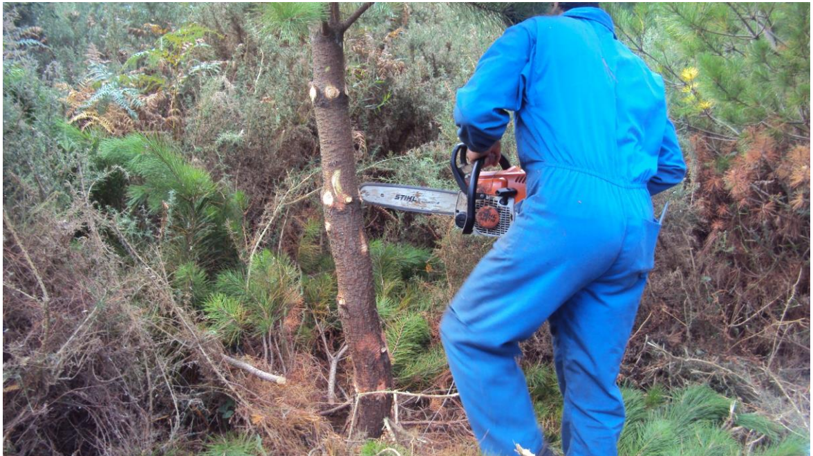
Podas manuales, Cedeira 2.010.