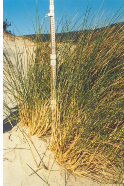
Plantación de A. vivero arenaria