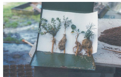
Ensayos de cultivo en vivero