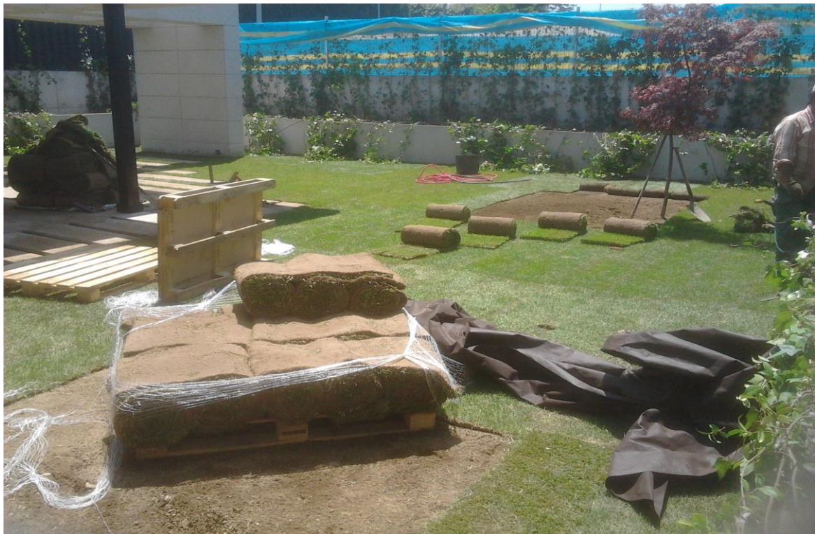
Colocación tepe, Oleiros 2.013