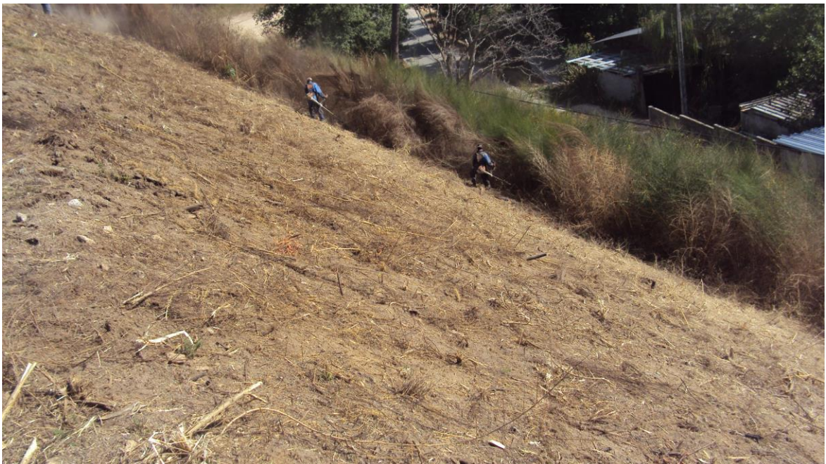
Desbroces manuales en taludes (Mos, 2.010)