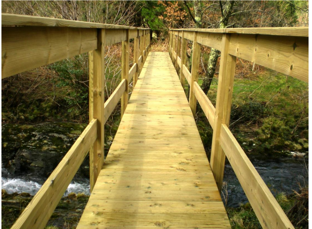
Construcción pasarela madera en Ambosores-Mañón, 2.008.