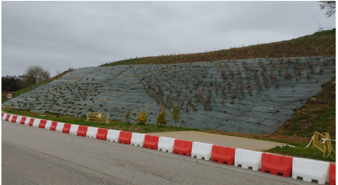
Cubrición malla antihierba en condiciones adversas, C. Cultura Santiago 2.023