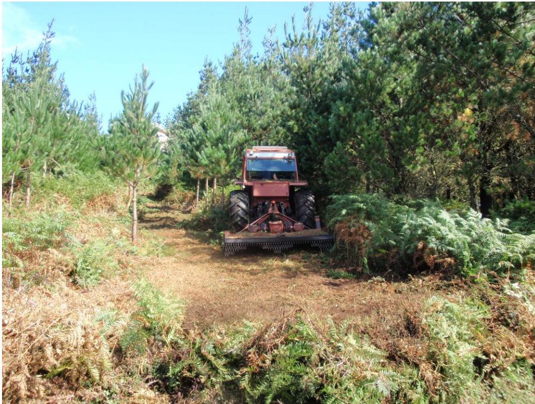
Roza mecanizada con desbrozadora de cadenas, Cedeira 2.010