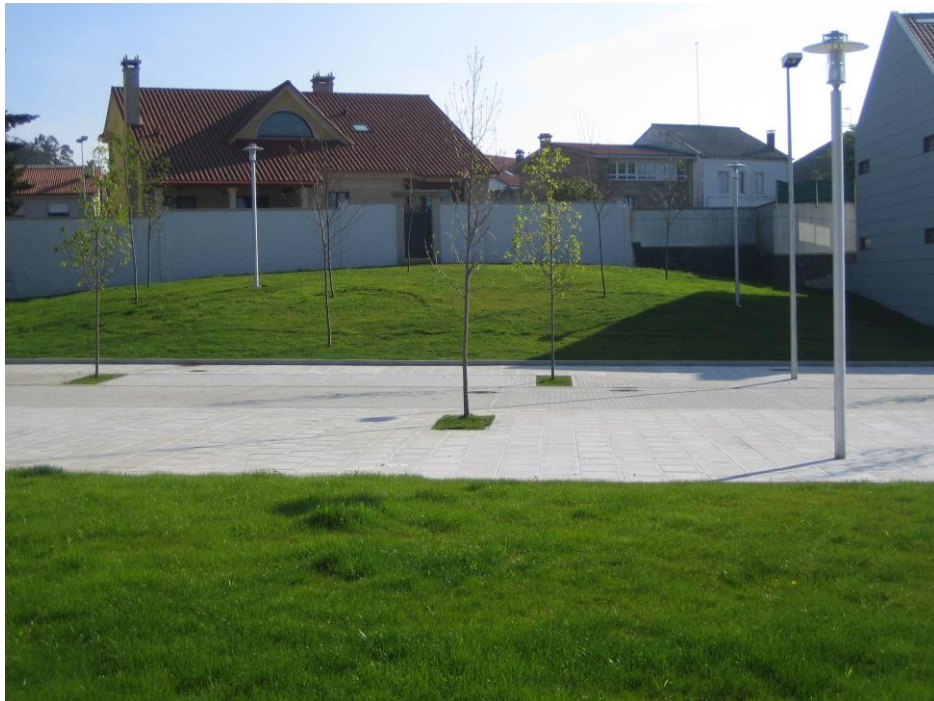
Sembrado césped, riego automatizado y plantación arbolado en Castiñeiriño, 2.009.