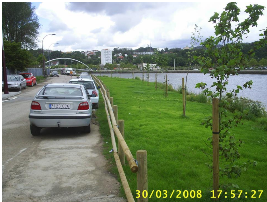
Césped al mes de realizada la hidrosiembra+plantación Liquidambar+valla madera tratada (Pontevedra ciudad, 2.007)