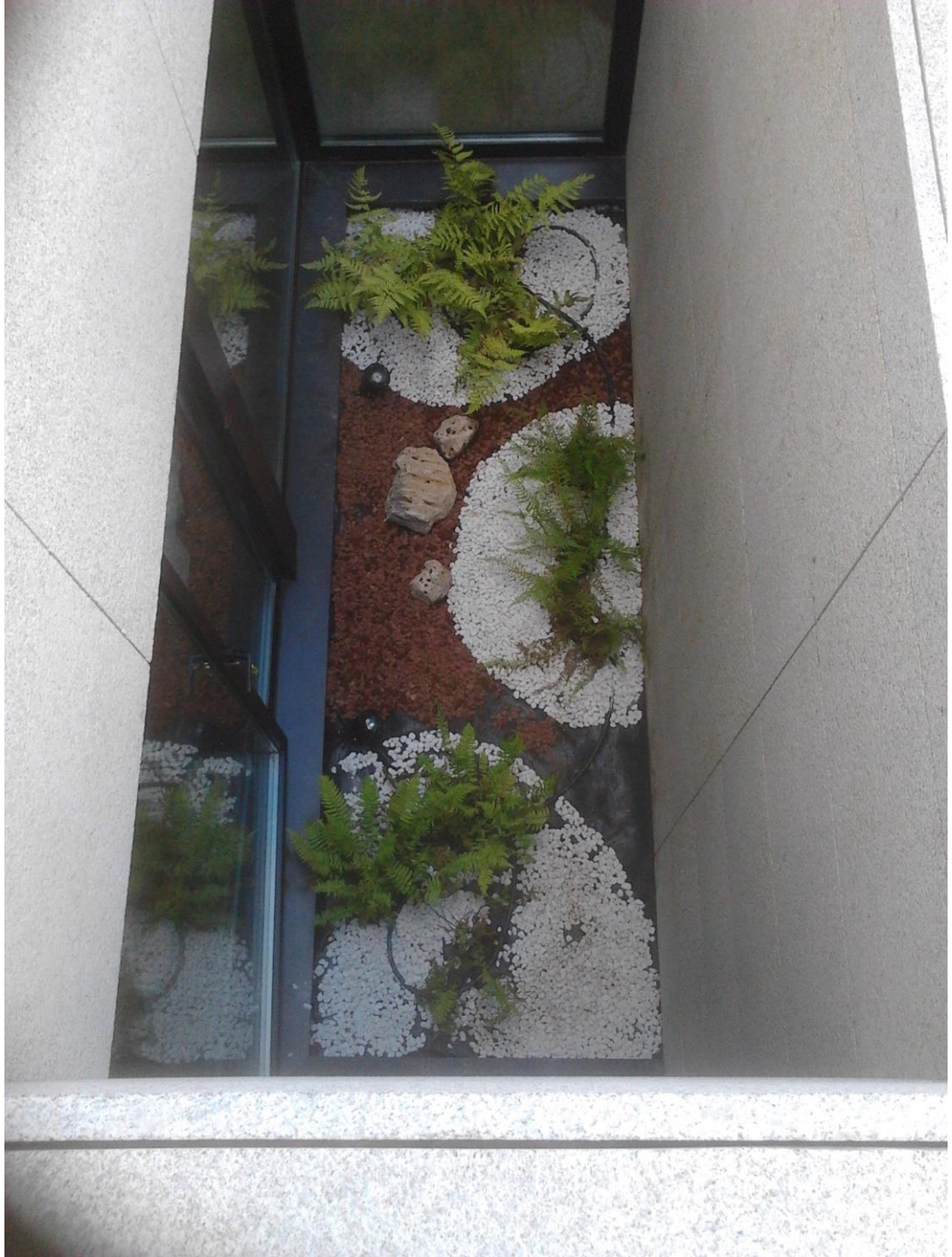
Jardinería de interiores, Perillo -A Coruña, 2013

Plantación bambúes, sembrado césped y riego automatizado en Sigüeiro, 2006.